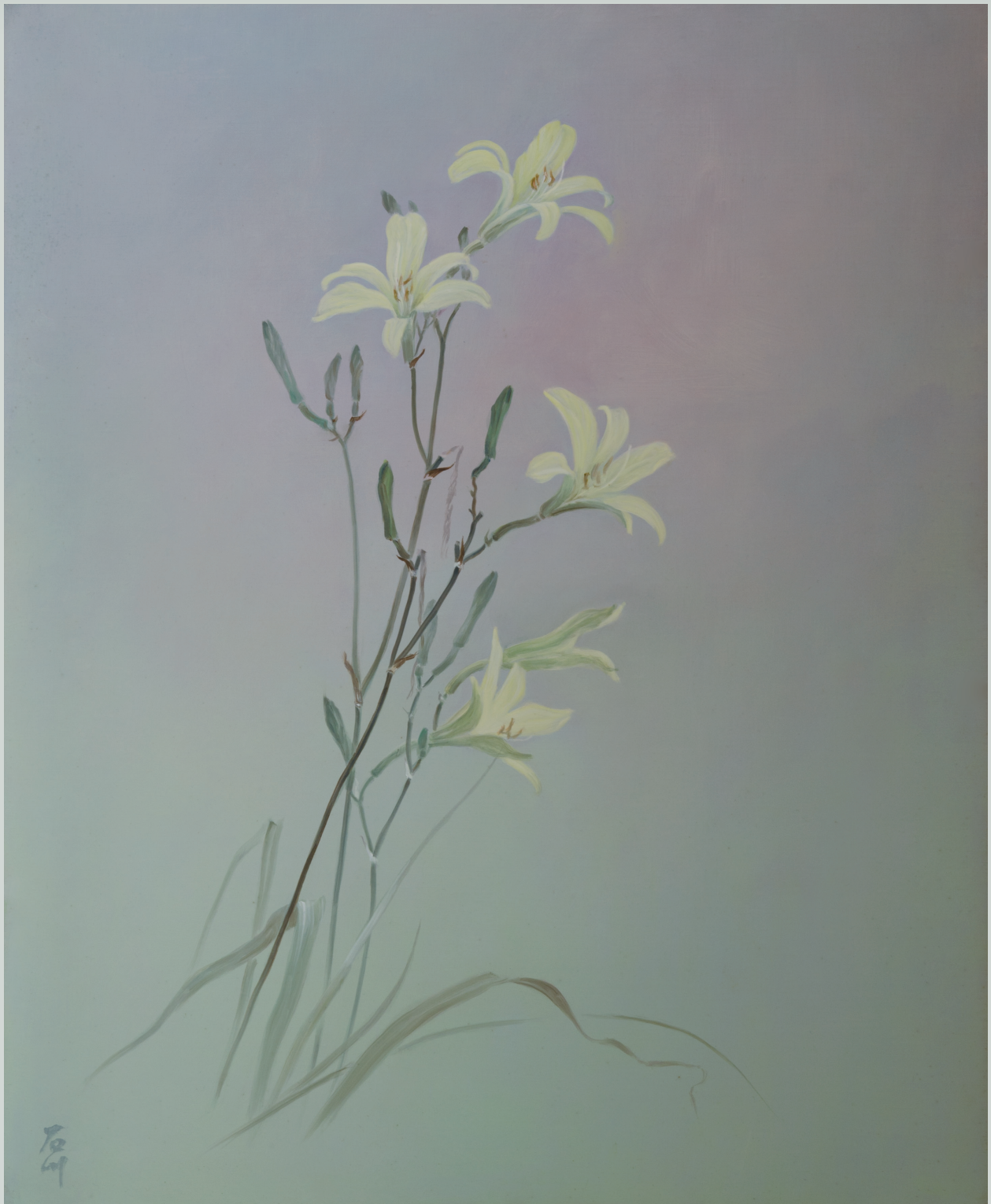
Kouichi Ishikawa 《Yusuge (Asamakisuge)》1997 c/o 15F